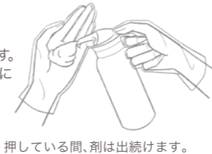
押している間、剤は出続けます。

※中身の量が少なくなると、剤の出る速度が遅くなります。 ※寒冷時、剤が出にくい場合は、ボトルをぬるま湯に数分浸してからご使用ください。