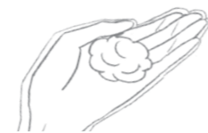
ピンポン玉1個分の目安

ショートヘア全体 ピンポン玉 3~4個分 セミロングヘア全体 ピンポン玉 約5個分 ボトル1本でショートヘア全体で約4回分(つけかえ用は約5回分)です。